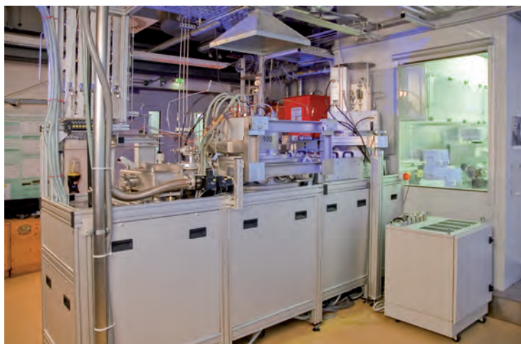
Mit dieser Anlage können Fraunhofer-Forscher piezoelektrische AIN-Schichten für Low-Power-Sensoren wirtschaftlich herstellen